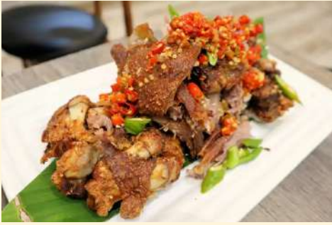
Mangan Restaurant (菲式料理)