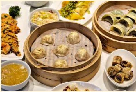
Lugang Cafe 鹿港小鎮 (中式料理)