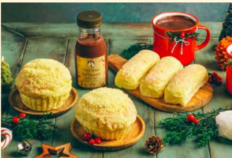
Mary Grace (菲式糕點)