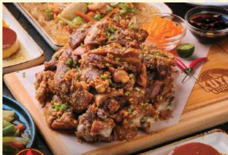
Kuya J's (亞州式料理)