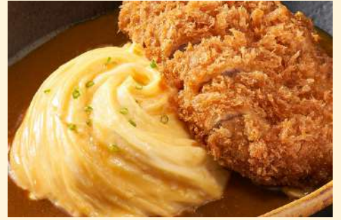
YABU日式豬排 (日式料理)