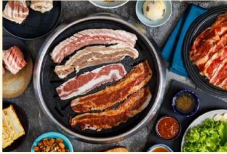
Soban 烤肉 (韓式料理)