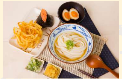
丸龜製麵 (日式料理)